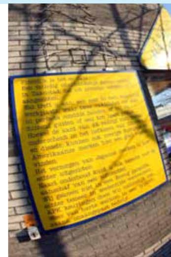
Deze reclameboodschap is eerder een manifest dan een advertentie.

Guus Göbel vecht als een ware partizaan tegen de vertrutting van de samenleving.