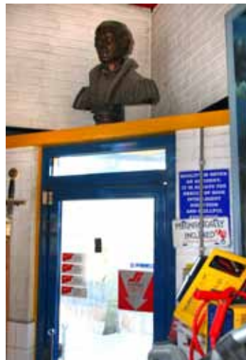
Constantijn Huygens zegt de klant van boven de deur gedag.