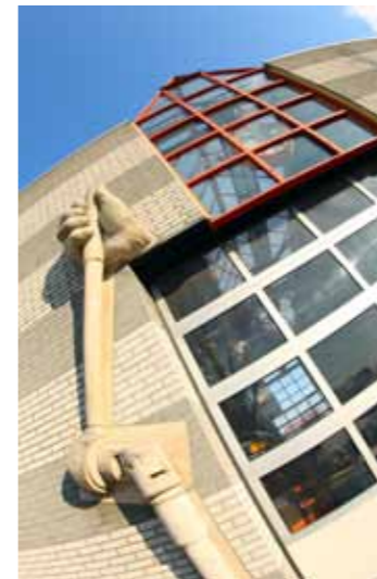
Een hand van de zoon van Guus werd door een klant omgezet in een waar kunstwerk.